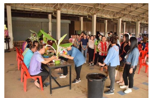
รดน้ำดำหัว คณะผู้บริหารท้องถิ่น สมาชิกสภาเทศบาล