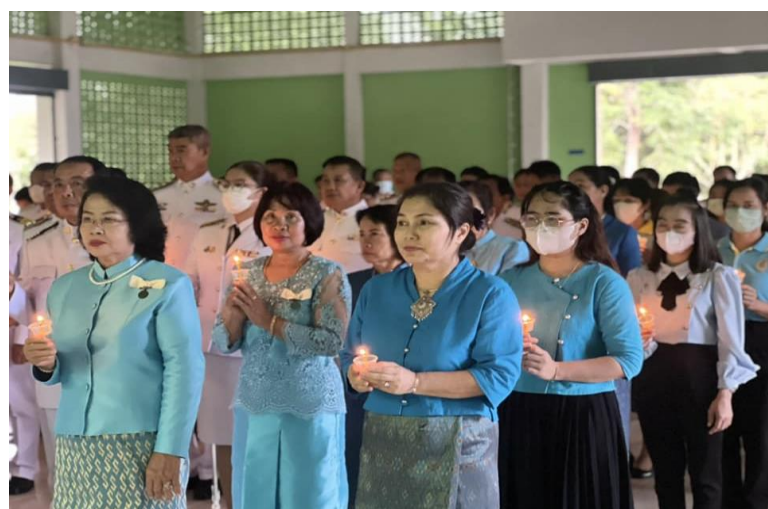
วันแม่แห่งชาติ