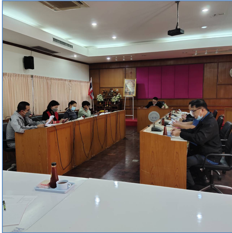
รูปภาพการประชุมคณะกรรมการติดตามและประเมินผลแผนพัฒนาเทศบาลตำบลปากอ่ดำ